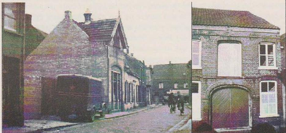
Afbeelding 5: Foto's van het bedrijfspand Chr. HERMANS in de Molenstraat uit 1947