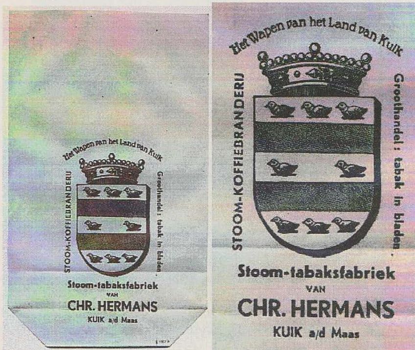
Afbeelding 2: Tabaksverpakking van het bedrijf CHR. HERMANS uit 1920

Om te beginnen zien we hier een afbeelding van een papieren tabakszak uit 1920 waarop we boven de kroon de merknaam zien staan die vrijwel gelijk is aan de tekst op de linkerzijde van de pijpenkop. Ook de tekst aan de rechterzijde op de verpakking is gelijk aan de tekst op de pijpenkop rond de tabaksplant. En uiteraard komt het wapenschild overeen. Met deze overeenkomsten mogen we aannemen dat zowel de pijp als de verpakking voor hetzelfde bedrijf bestemd waren.